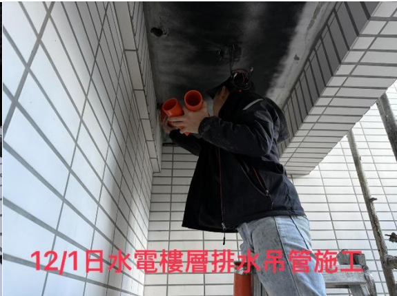
12/1日水電樓層排水吊管施工