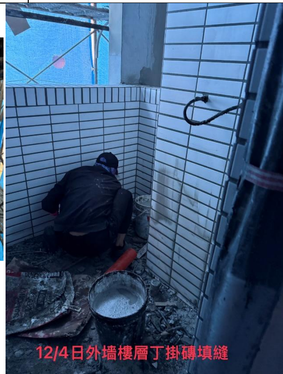
12/4日外牆樓層丁掛磚填縫